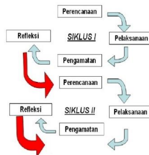
Gambar. Alur PTK Kemmis, McTaggart, & Nixon (1988)

Subyek penelitian yang ditunjukkan oleh peneliti. Subyek penelitian yang nanti akan menerima perlakuan dari peneliti terkait dengan penelitian yang dilakukan (Tokan, 2016). Tempat penelitian yang dijadikan penelitian tindakan kelas ini adalah UPTD SDN GULBUNG I, yang berlokasi di samping. Dalam subyek penelitian ialah siswa kelas 1 UPTD SDN GULBUNG I yang berjumlah 21 siswa, dengan rincian 12 siswa laki-laki dan 9 siswa perempuan. Dalam pelaksanaan penelitian ini, peneliti menggunakan metode penelitian tindakan kelas (PTK). Penelitian tindakan kelas merupakan cara yang dibuat oleh guru untuk membantu membenahi kualitas pembelajaran yang dilakukan. Penelitian ini berdasarkan pada persoalan pembelajaran yang dihadapi oleh peserta didik. Penelitian ini mengarah pada perbaikan pembelajaran yang berkelanjutan. Model penelitian tindakan kelas menurut Kemmis, McTaggart, & Nixon merupakan model penelitian tindakan yang berbentuk spiral yang terdiri dari 2 siklus dengan 4 tahapan yaitu: 1) perencanaan (plan); 2) tindakan (act); 3) observasi (observe); dan refleksi (reflect). Siklus ini terus berlanjut dan akan berhenti bila sudah memenuhi kebutuhan. Tahapan-tahapan dalam penelitian tindakan kelas akan diuraikan sebagai berikut.