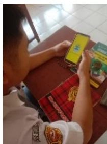
Gambar 1.1 Peserta didik membuat akun pada aplikasi I Jateng

Langkah pertama dalam implementasi aplikasi I Jateng adalah persiapan materi oleh guru. Guru mengumpulkan berbagai teks biografi yang relevan dan memasukkannya ke dalam aplikasi. Materi ini mencakup biografi tokoh-tokoh terkenal yang dapat memberikan inspirasi kepada peserta didik. Guru juga perlu membuat panduan penggunaan aplikasi agar peserta didik dapat mengakses dan memanfaatkan fitur-fitur yang tersedia dengan mudah. Persiapan ini meliputi pembuatan akun peserta didik, pengaturan kelas virtual, dan pengunggahan materi ajar. Selain itu, guru juga perlu memastikan bahwa semua perangkat teknologi yang diperlukan, seperti komputer dan koneksi internet, tersedia dan berfungsi dengan baik.