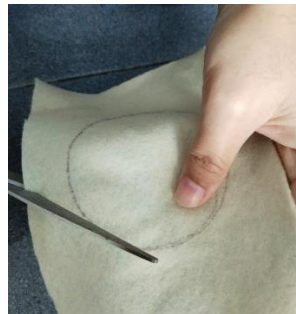
Gambar 4.3 Menggunting Pola Lingkaran