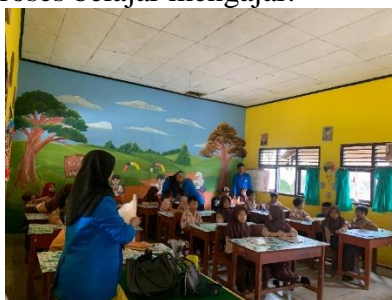
Gambar 4.6 Implementasi Media Boneka Tangan

Selain itu, hasil positif yang diperoleh dari implementasi media boneka tangan berbasis audiovisual dengan bantuan video juga menunjukkan potensi besar dalam meningkatkan keterlibatan siswa dalam pembelajaran. Dengan adanya media ini, guru memiliki kesempatan untuk menciptakan suasana pembelajaran yang lebih interaktif dan menarik bagi siswa. Penggunaan media boneka tangan berbasis audiovisual juga dapat memperkaya metode pengajaran yang ada, memungkinkan siswa untuk belajar melalui pendekatan visual dan auditori yang lebih menarik. Dengan demikian, integrasi media ini tidak hanya dapat meningkatkan pemahaman siswa terhadap materi pelajaran, tetapi juga dapat memotivasi mereka untuk lebih aktif dalam proses belajar mengajar.