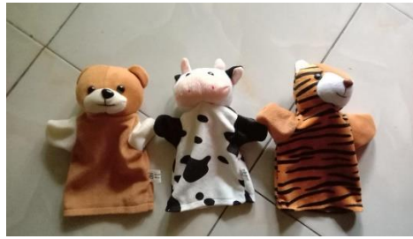
Gambar 4.5 Boneka Tangan