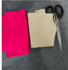
Gambar 4.1 Alat dan Bahan

sebuah pertunjukan cerita yang dapat disesuaikan dengan materi pembelajaran. Proses pengembangan media ini dimulai dengan pembuatan prototipe yang kemudian dilakukan setelah melakukan analisis kebutuhan melalui penggunaan kuesioner oleh siswa dan guru. Analisis kebutuhan dilakukan untuk memastikan bahwa media yang dikembangkan benar-benar bermanfaat dan sesuai dengan karakteristik belajar. Hasil dari analisis kebutuhan dan rancangan media boneka tangan digunakan untuk menyusun prototipe media boneka tangan berbasis audiovisual. Selanjutnya, desain produk merupakan tahap untuk mengubah prototipe media menjadi media yang nyata dan siap digunakan dalam proses pembelajaran. Langkah pembuatan media boneka tangan berbasis audiovisual disajikan sebagai berikut.