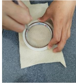
Gambar 4.2 Gambar Pola